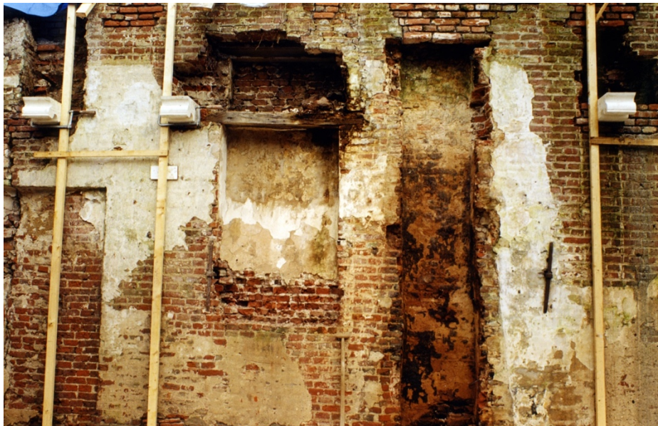
Historische muur van Huys der kunsten, ten tijde van de ingrijpende restauratie 2001.

De drie onderdelen van Hart van de Handel, de schilderijen, de vondsten en het ambacht vertellen samen het verhaal van Kampen als Hanzestad. Het project 'Hart van de Handel' draagt bij in de sfeer en beleving van de Middeleeuwen, de tijd van de Kamper Kogge, de glorie tijd van Kampen. Huys der Kunsten behoudt en bewaard twee Rijksmonumenten en de geschiedenis daarvan. Het museum toont de verbinding door de eeuwen, onder meer door te tonen hoe actueel archeologie is. Op deze wijze wordt een historisch en momenteel zeer geliefd ambacht, dat van het bierbrouwen, geactualiseerd en in verband met de geschiedenis getoond. Het immateriële erfgoed van de provincie Overijssel krijgt hiermee een belangrijke impuls, hiermee wordt het verhaal van Overijssel verteld, een verhaal dat in de Middeleeuwen begint en nu nog volop leeft!